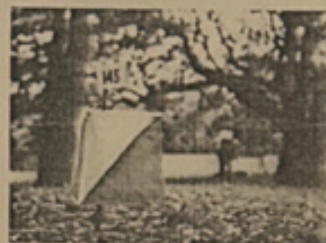
Fig. 3 Lanterna

La società sportiva ORIENTABC vuole automatizzare l'iscrizione degli atleti alle gare e la raccolta delle informazioni durante lo svolgimento delle gare. In particolare vuole introdurre un sistema che permetta la registrazione online degli atleti alle varie gare della stagione. Occorre anche un sistema di identificazione degli atleti che consenta ai giudici di gara, agli allenatori e al personale ausiliario di seguire la posizione degli atleti nel loro percorso di gara fino al traguardo. Si vuole, inoltre, permettere la consultazione online della classifica di gara aggiornata in tempo reale.