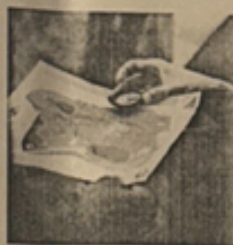
Fig. 2 Bussola e mappa